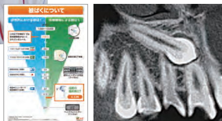
図1) RevoluXの被曝資料 図2) 埋伏歯の歯冠が[21]の根尖に近接している。